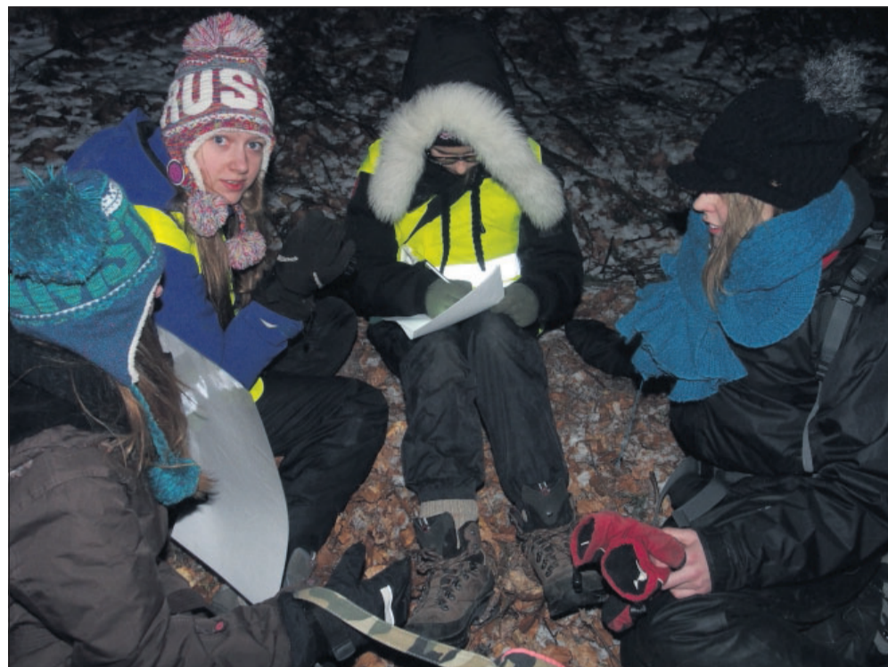
Ikke så nemt at løse skriftlige opgaver med tykke vanter og huen langt ned i panden.