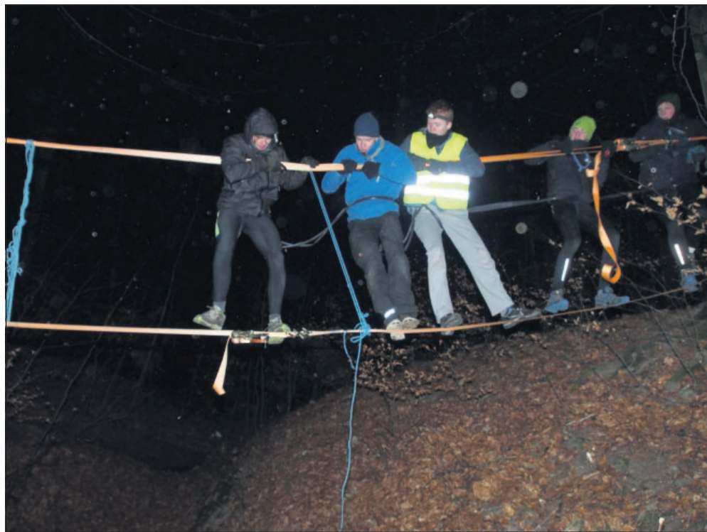
Klatring i riggen på en forhindringsbane, hvor patruljen var bundet sammen med cykelslanger.