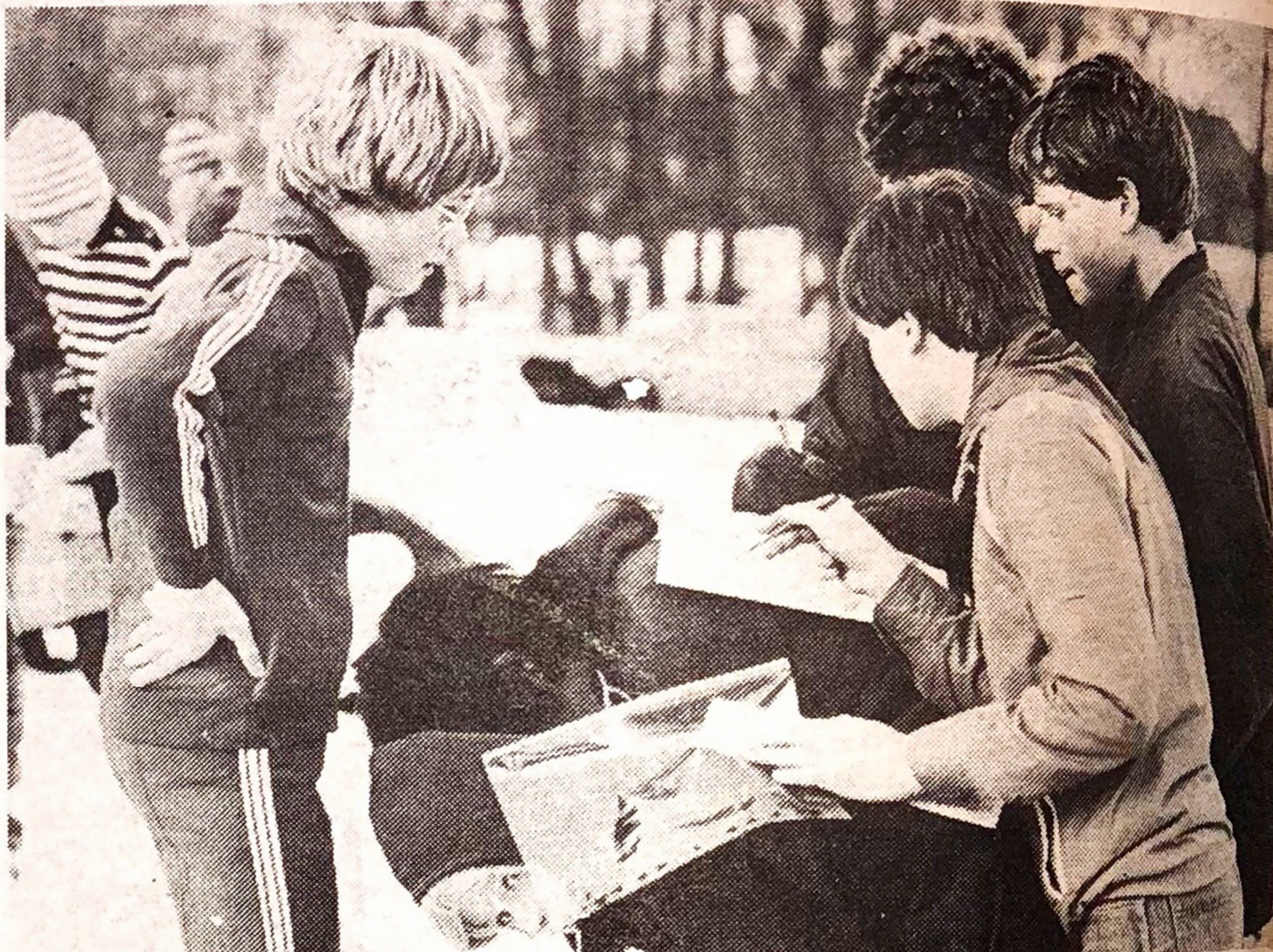
En hurtig orientering på kortet, og så af sted. En kammerats ryg tjener som transportbort kortbord.

Stemningen var helt i top under den lange og hårde øvelse.