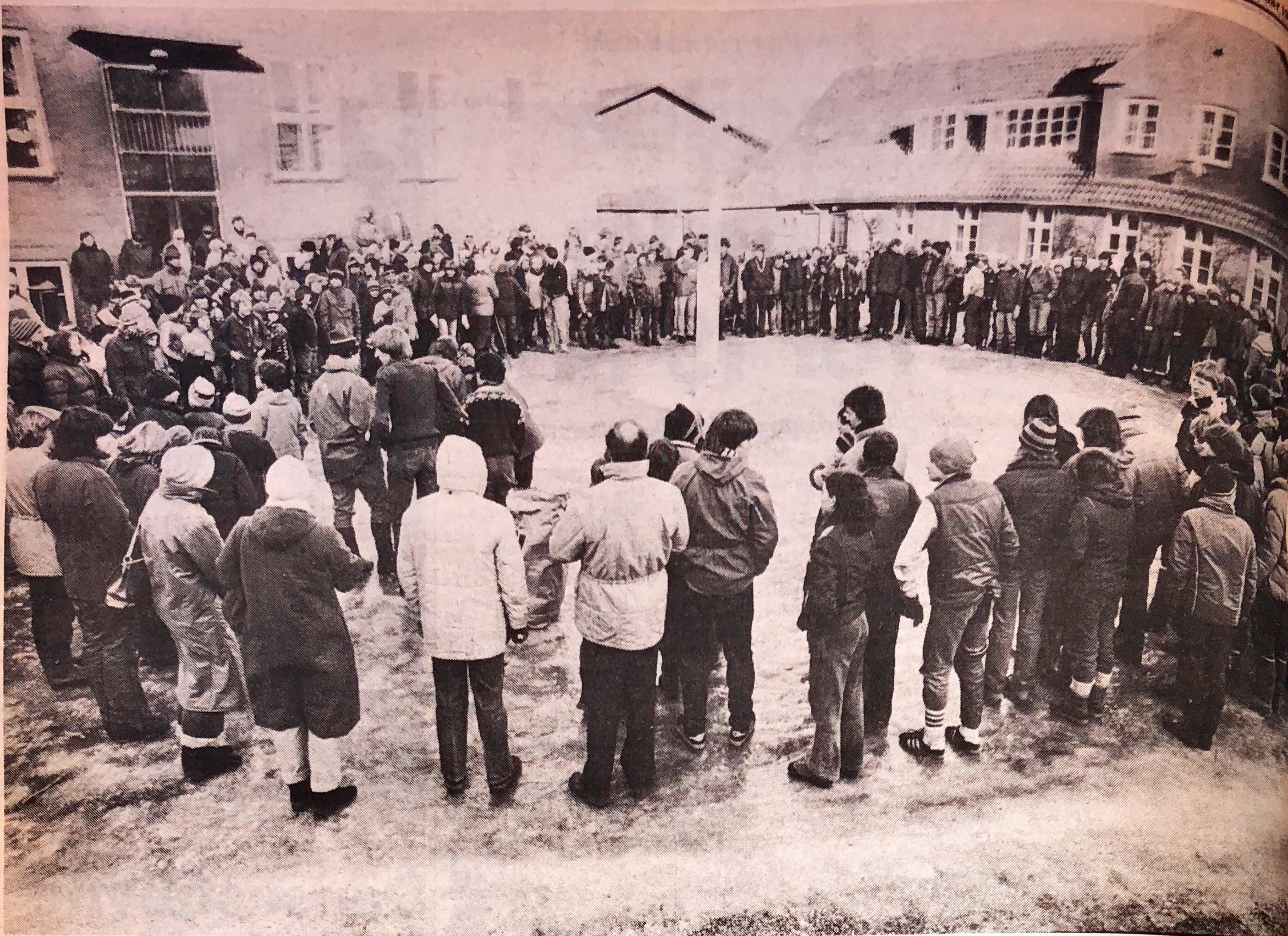
De cirka 230 spejdere ved afslutningen på Dinizuli-løbet rundt om Hellebæk Skoles flagstang i går formiddags.