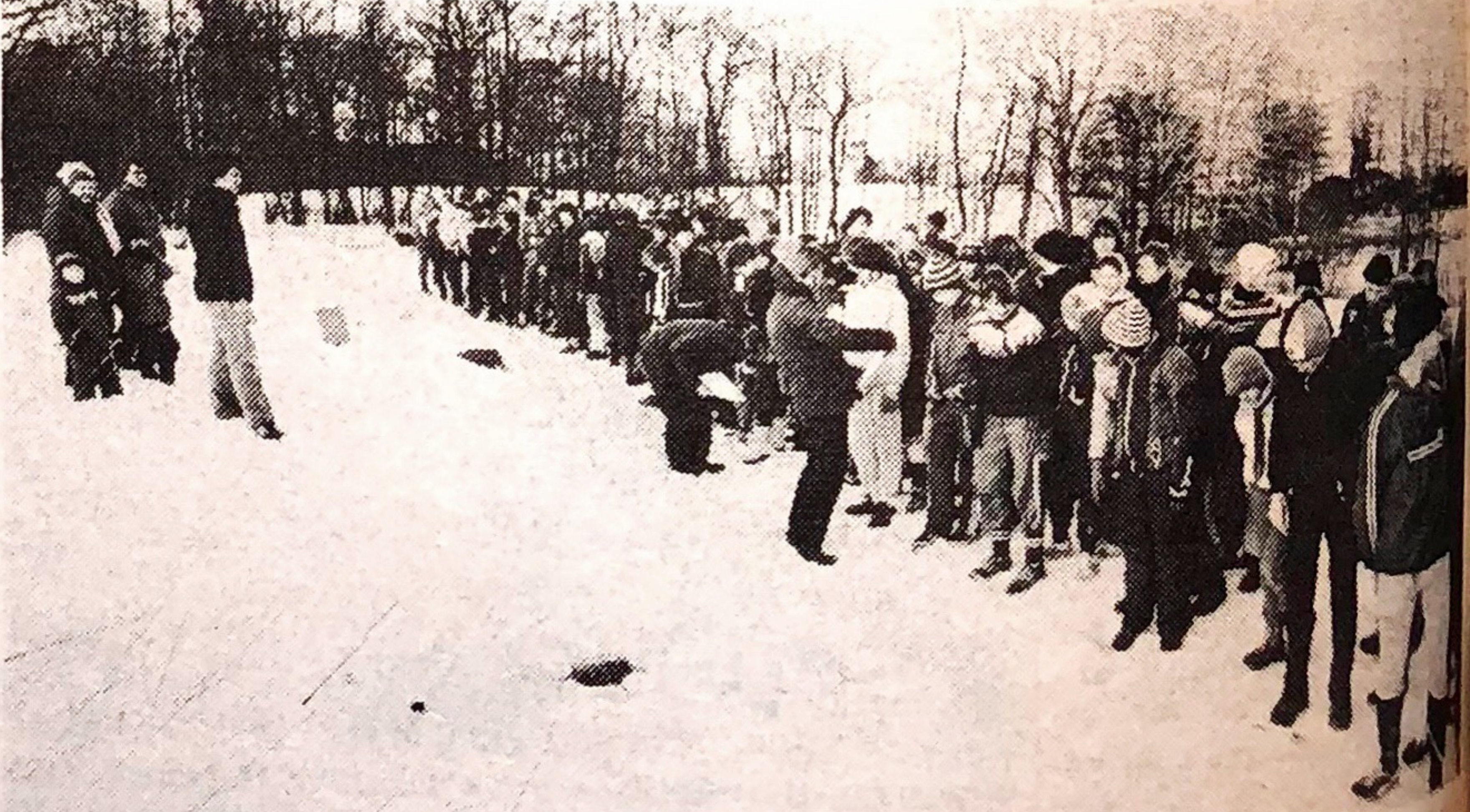
Fra starten på det indledende point-løb. Man havde en time til at gennemføre.